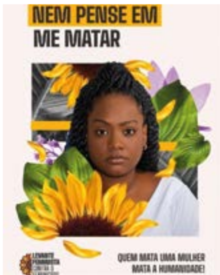
Levante Feminista contra o Femicídio

Infelizmente, até o presente (junho 2022) não houve alteração substancial desta situação que acarreta uma violação aos direitos das mulheres de buscar serviços especializados para o atendimento de suas demandas. O retorno do MP/RS não acarretou mudança na situação. O Centro de Referência segue num espaço inadequado para suas funções. A Força Tarefa Contra o Femicídio não recebeu nenhuma informação de que atendimentos estejam ocorrendo e, menos ainda, o retorno dos órgãos fiscalizadores de como ficará a situação.