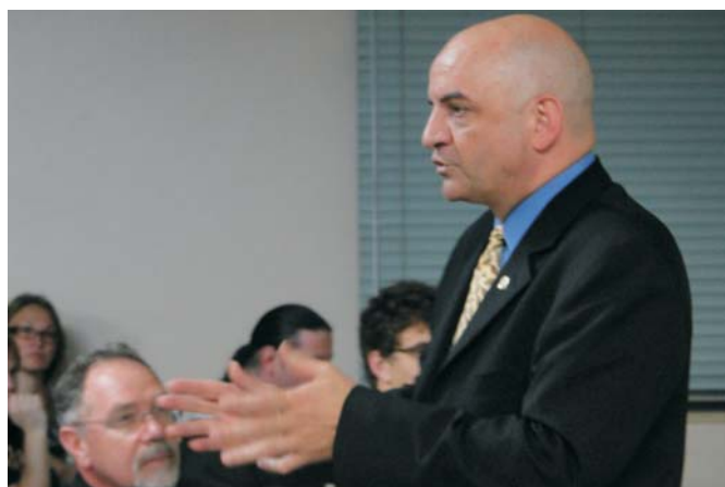
Alunos da UFRGS prestigiam palestra "O Impacto Social da Auditoria"

Iniciando as conversas no ano de 2013, O Ceape, no dia 14 de março, teve a oportunidade de conversar com mais de 200 acadêmicos de Ciências Contábeis e Tecnólogo em Gestão Financeira no Centro Universitário La Salle. A palestra de Perusso contou com interatividade dos