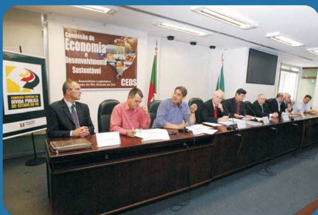
Comissão Especial da Dívida Pública do RS

Alguns dados obtidos a partir do documento produzido pela SEFAZ/RS denominado "Dívida Pública Estadual – Relatório Anual 2012" merecem destaque.