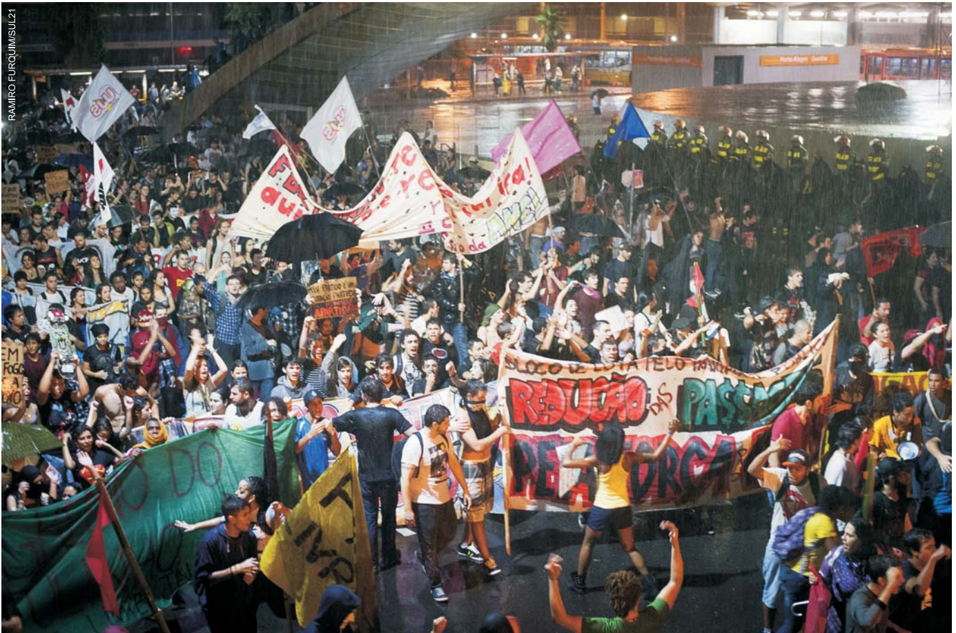
Relatório de auditoria realizado pelos auditores do Tribunal de Contas do Estado resultou na redução do valor da passagem de Porto Alegre. Na foto, uma das maiores mobilizações na Capital gaúcha.

Auditoria na EPTC – para “avaliar possíveis irregularidades no cálculo da tarifa do transporte coletivo urbano de passageiros de Porto Alegre”.